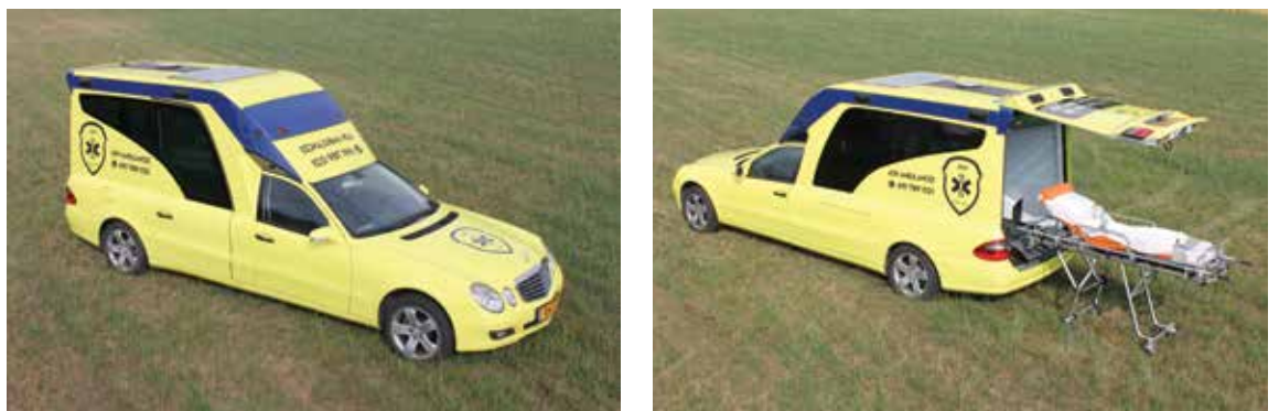
Mercedes-Benz E280 mit Aufbau von Visser aus Leeuwarden in den Niederlanden