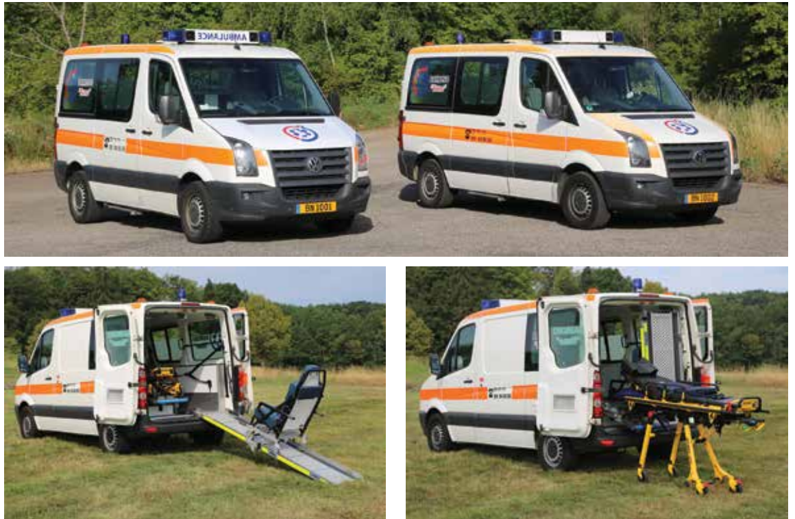
Ein zweiter Krankenwagen gleichen Typs wurde bei Ambulance Barroso in Dienst gestellt. Volkswagen Crafter mit Innenausbau von Binz Ambulance aus Ilmenau (D)