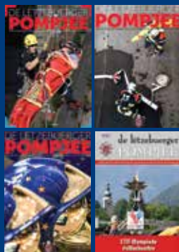
Foto Concours fir d'Titelsäit vum lëtzeburger Pompjee