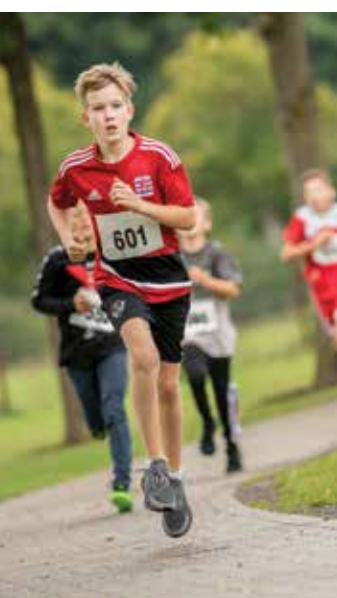
Text: Patrick Muller