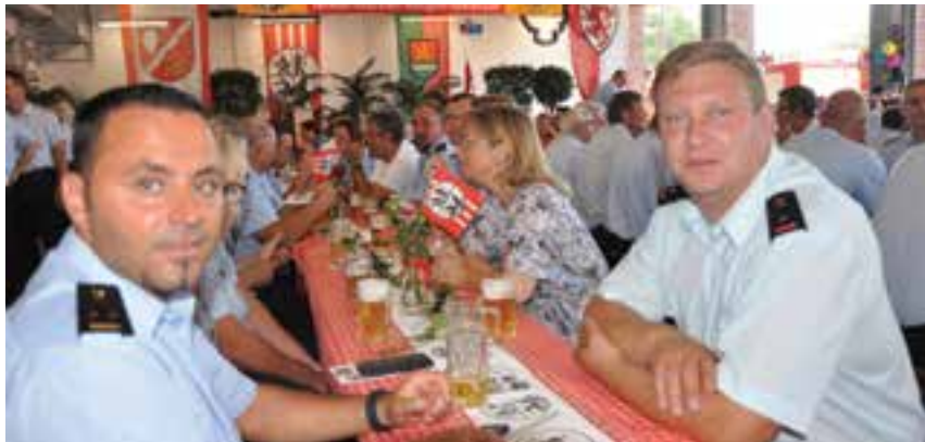
Delegation der Feuerwehr Mersch