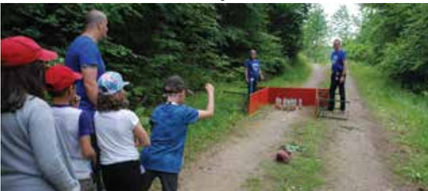
Spiel bei der Rallye