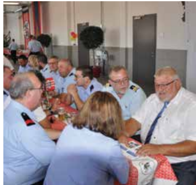
Delegation der Feuerwehr Mersch