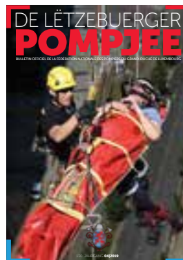
Edition 04/2019