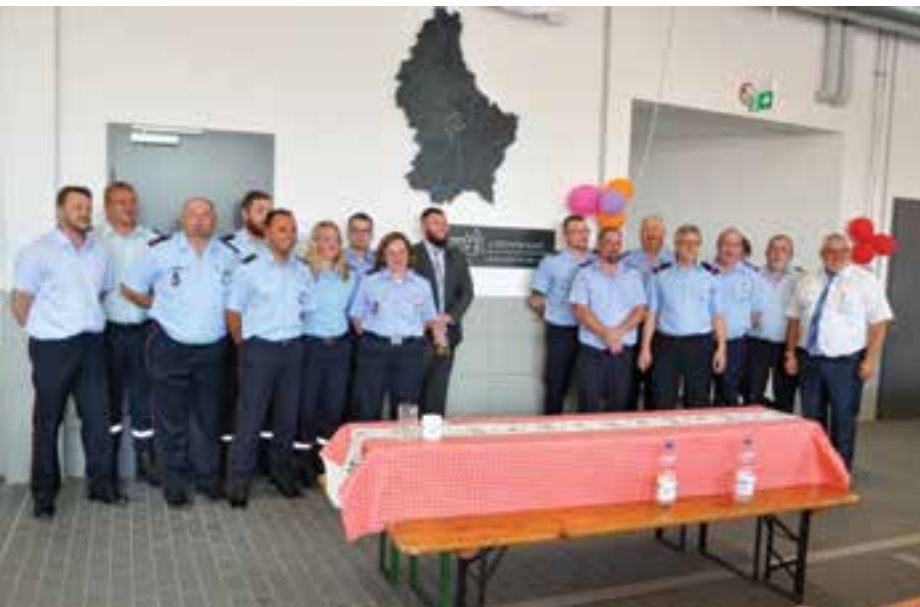
Die Delegation aus Mersch vor dem Geschenk

Strukturen zu fördern. „Arbeiten Sie erfolgreich für den Schutz und die Sicherheit der Bürgerinnen und Bürger zusammen und kommen Sie aus jedem Einsatz wohl behalten zurück“, so ihr Appell an die Wehren Rethen und Gleidingen. Als weitere Redner traten der Bürgermeister der Gemeinde Mersch Michel Malherbe, sowie Vertreter der befreundeten Wehren und der Kinder- und Jugendfeuerwehr auf. Bei dieser Gelegenheit enthüllte die Feuerwehr Mersch ihr Gastgeschenk, die Landkarte Luxemburgs in Stahl aus welcher die Gemeinde Mersch hervorsticht.