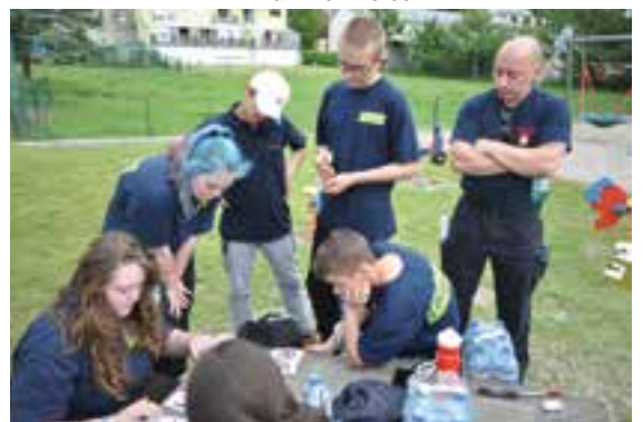
Spiel bei der Rallye