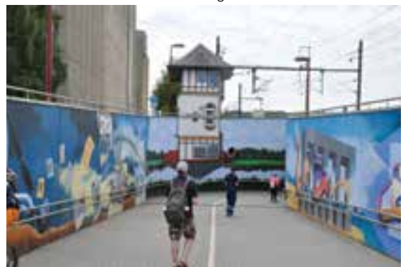
Am Bahnhof Mersch