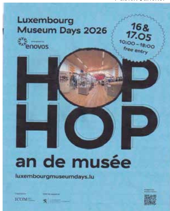
Museum Days den 16. a 17. Mee 2026 am Pompjeesmusée zu Woltz