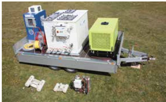
Ölabscheider im Jahre 2014 ohne Schutzgehäuse

Genauere Angaben und Funktionsweise können unter www.freylit.com nachgeschaut werden. Die Firma Freylit Umwelttechnik hat ihren Sitz in Klosterneuburg in Österreich