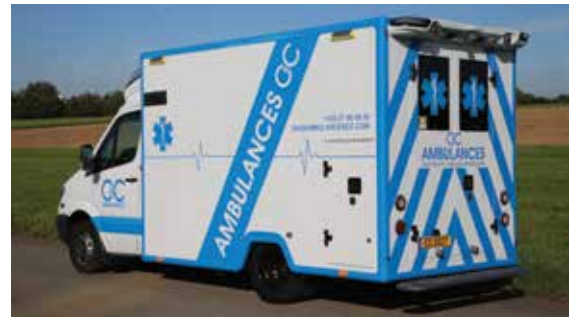
Die Beladung des Fahrzeugs ist im Begriff ergänzt zu werden.