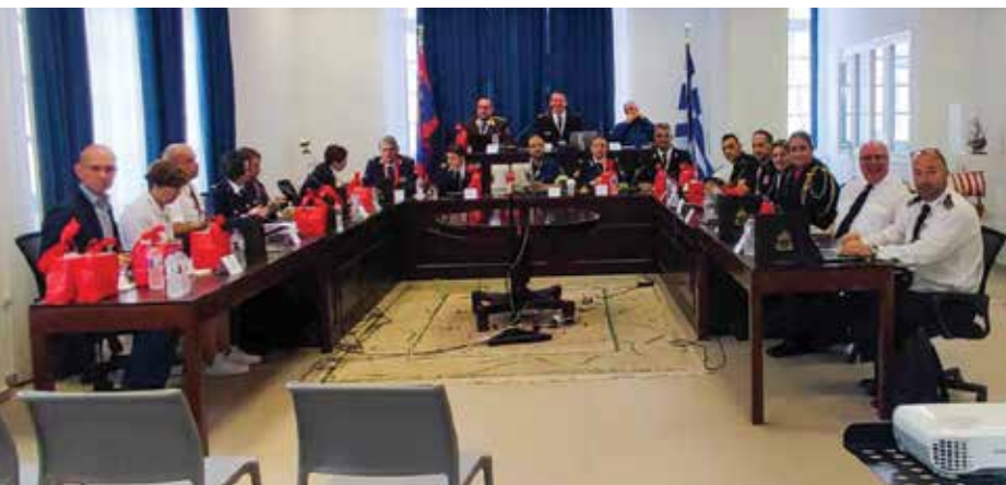
Die Tagung der CTIF-Kommission der Freiwilligen Feuerwehren auf der Insel Hydra, Griechenland am 18. Oktober 2023

In einer atemberaubend schönen Landschaft kamen 22 Teilnehmer aus 12 Ländern zusammen, um über aktuelle Themen im Feuerwehrwesen zu diskutieren. Im Mittelpunkt des Treffens standen die Auswirkungen des Klimawandels auf die Arbeit der Feuerwehren. Wie müssen sich die (freiwilligen) Feuerwehren an die veränderten klimatischen Bedingungen anpassen?