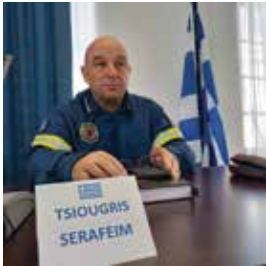
Serafeim Tsiougris, Präsident der Griechischen Vereinigung der Freiwilligen Feuerwehr (Griechenland)

Arbeitnehmern. Es gilt nur für Großeinsätze (8h > 100 Einsatzkräfte).