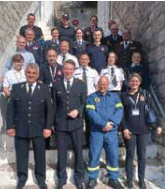
Die CTIF-Kommission für Freiwillige Feuerwehren fotografierte am 18. Oktober während der Tagung auf der Insel Hydra, Griechenland.