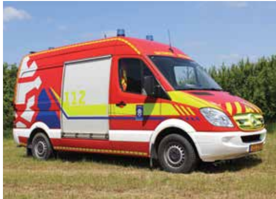
GW 1 (Gerätewagen) Mercedes-Benz Sprinter