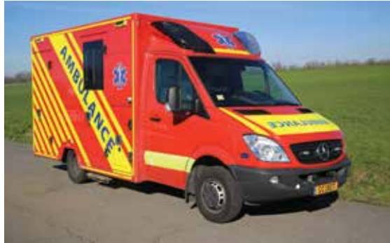
Vor der Umlackierung

Ein vom CGDIS ausgemusterter Rettungswagen wurde nach kompletter Grundüberholung mit veränderter Lackierung von Taxis-Ambulances CC in den Dienst gestellt.