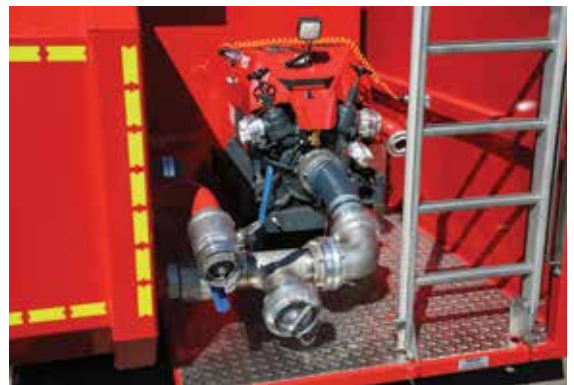
Faltbarer Löschwasserbehälter mit 13250 Liter Fassungsvermögen