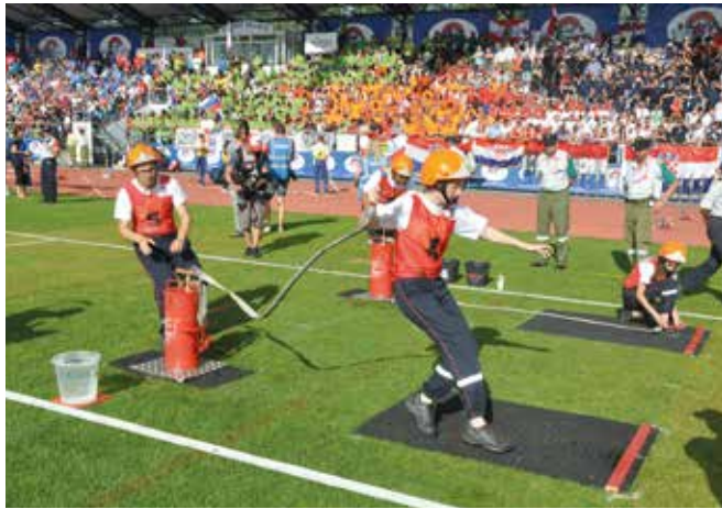
Luxemburg 1 im Einsatz