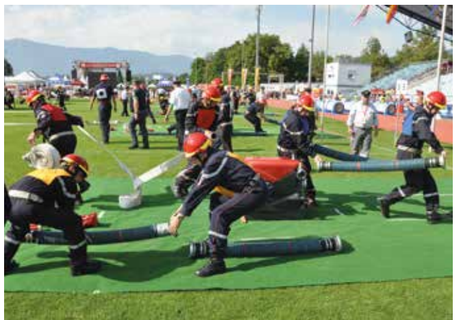
Die Mannschaft aus Weiler-Putscheid beim Training