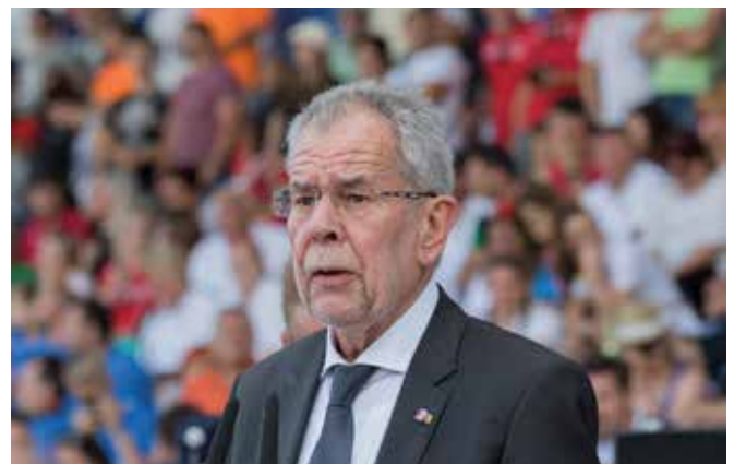
Der österreichische Bundespräsident Dr. Alexander van der Bellen

Die feierliche Eröffnungszeremonie fand am 12. Juli im Stadion in Villach statt. Ungefähr 3.000 Sportler und Bewerber hatten sich eingefunden um an diesem Festakt teilzunehmen. Circa 8.000 Zuschauer füllten die Tribünen, unter ihnen waren der österreichische Bundespräsident, der Innenminister, der Landeshaupt-