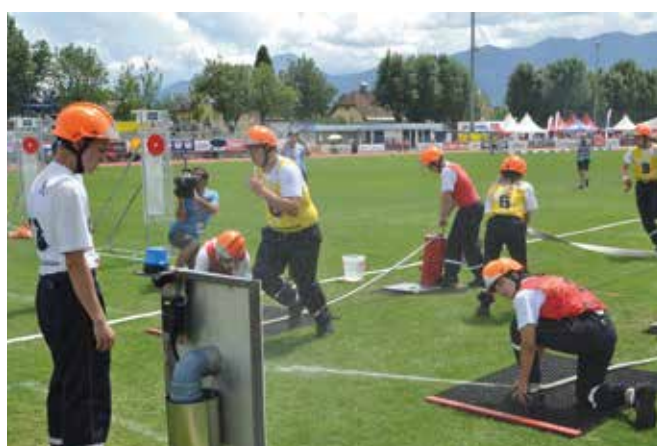
Luxemburg 2 in Aktion