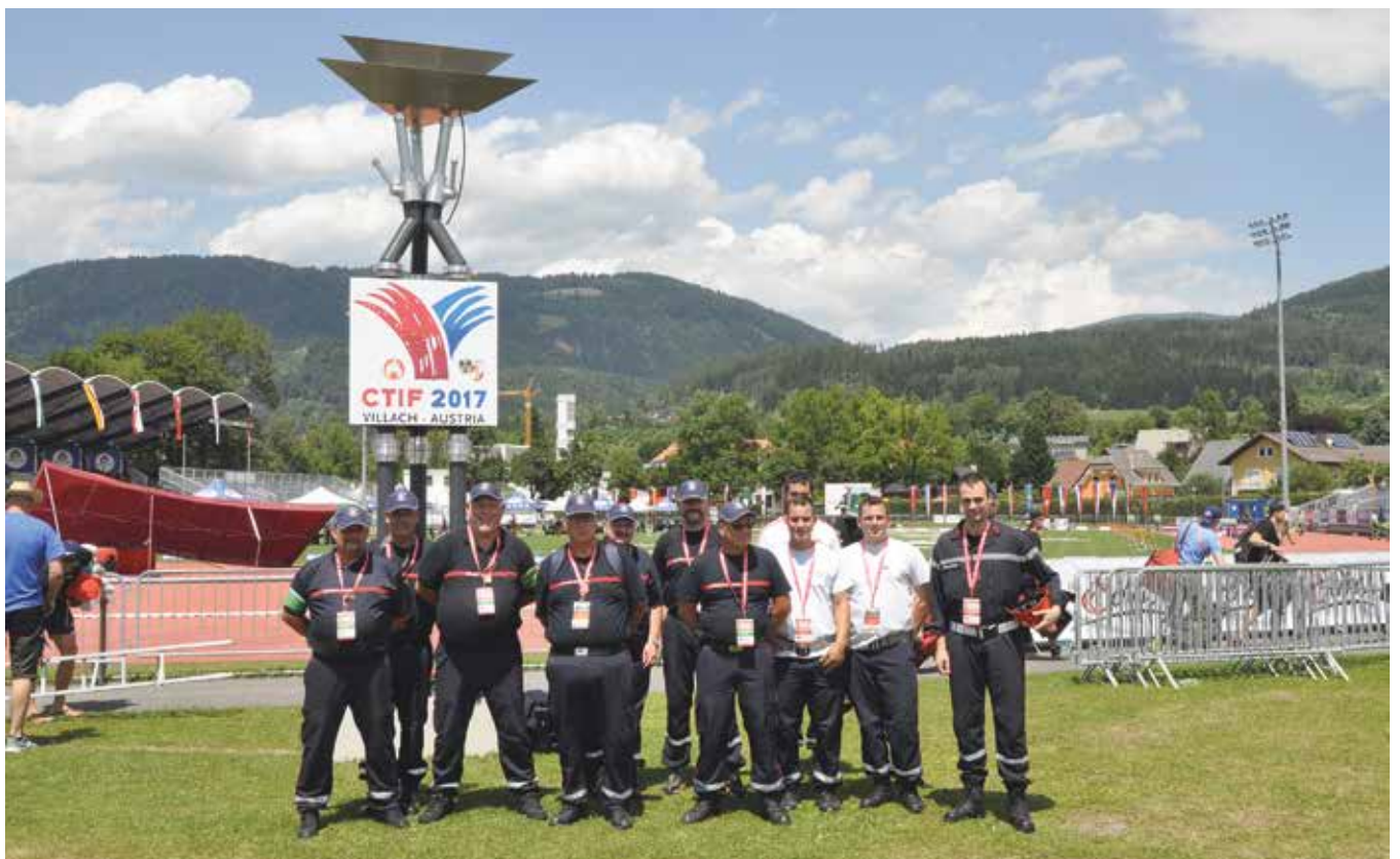
Luxemburger Bewerber mit Freunden