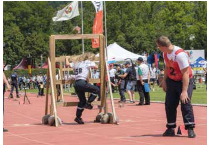
Luxemburg 2 beim Staffellauf