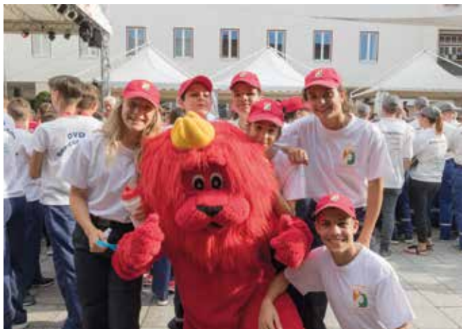
Das luxemburgische Maskottchen