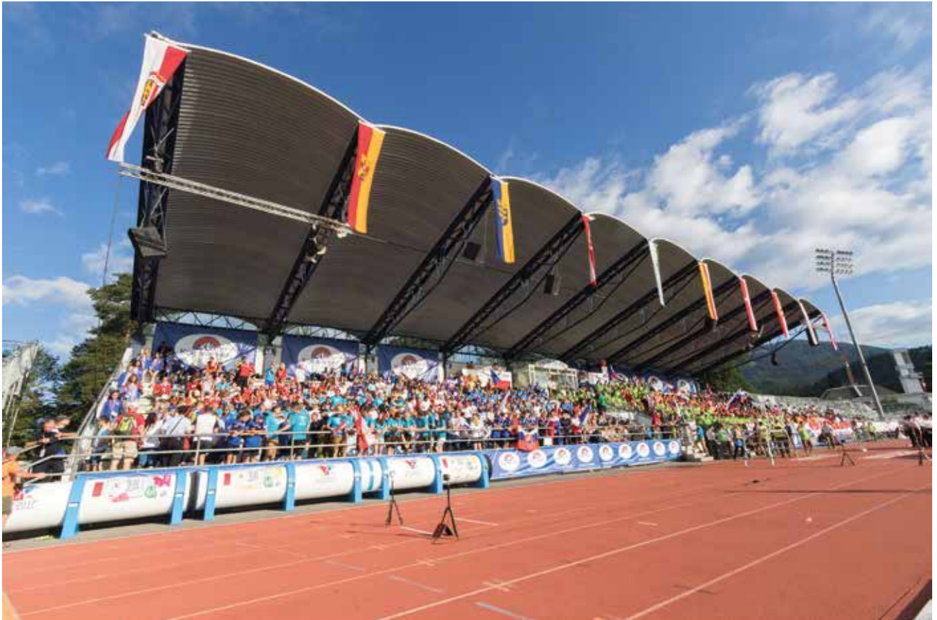
Spektakuläre Zuschauerkulisse im Stadion

Villach on Fire – so lautete das Motto der diesjährigen Feuerwehrolympiade, die vom 9.-16. Juli in Villach, Österreich, stattfand.