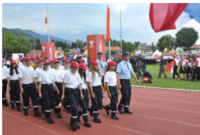
Jugend bei der Eröffnung

Am Samstag, dem 16 Juli, fand die Abschlussfeier der Feuerwehrolympiade statt. Mit einer spektakulären Show wurden die Athleten verabschiedet.