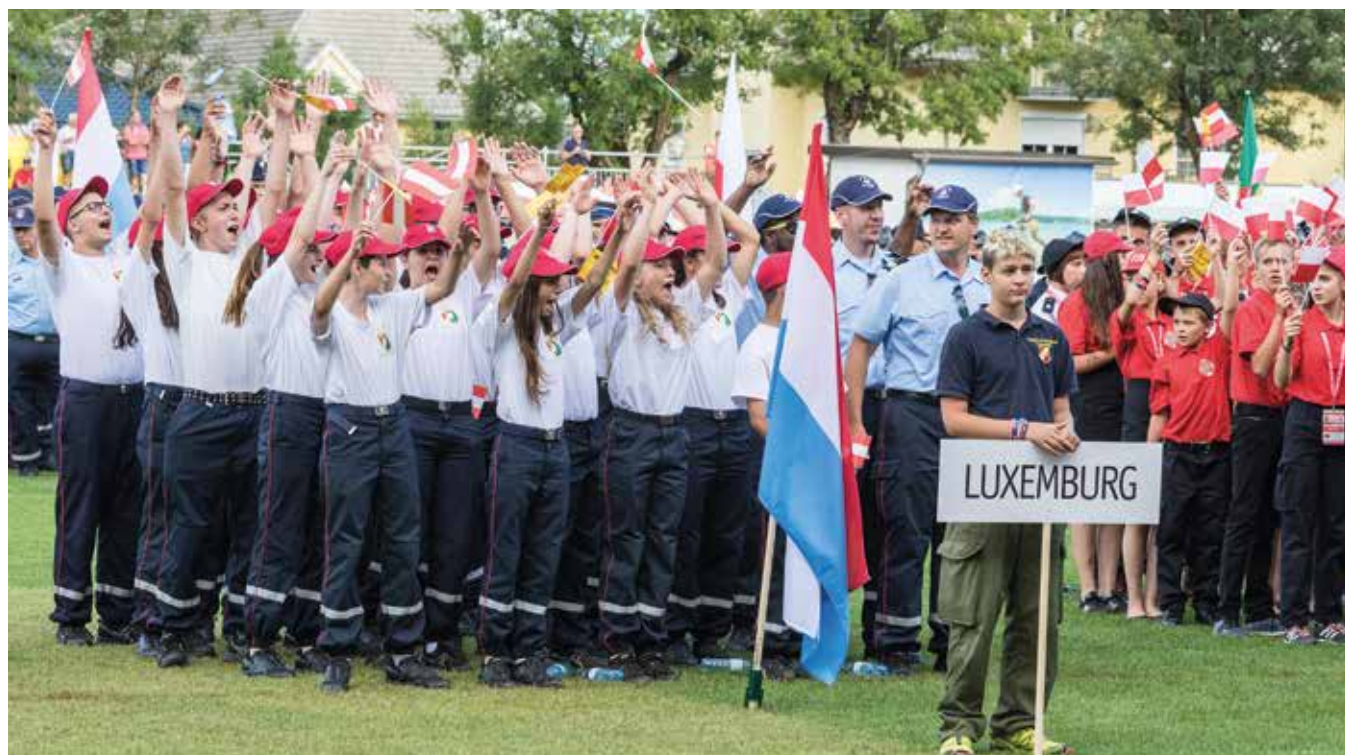
Jugend bei der Eröffnung